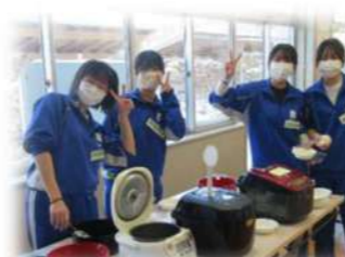
2月8日 冬のバーベキュー