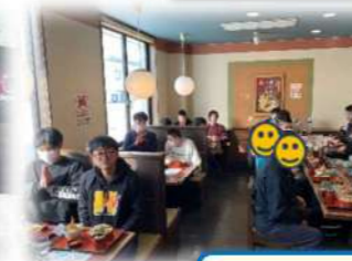
高校生ボランティア参加