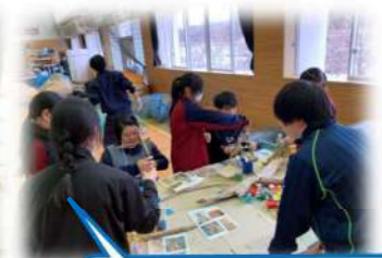
高校生ボランティア参加