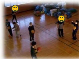
11月16日 スポーツ(バスケット)体験/クレープ作り