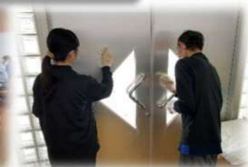
12月21日 年末大掃除/スターラボ