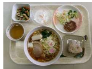
しょうゆラーメン