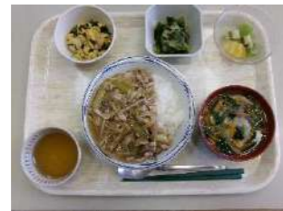
細切り肉かけご飯