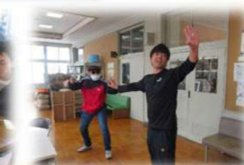
2月13日 不審者対応避難訓練・火災想定避難訓練