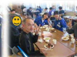
高校生ボランティア参加