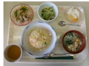
あんかけチャーハン