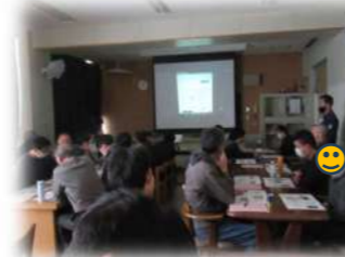
12月16日 お金の使い方勉強会