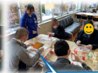
高校生ボランティア参加