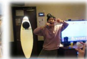
12月14日 利用者忘年会