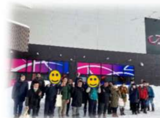
1月18日 映画鑑賞(外出)