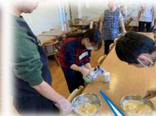
高校生ボランティア参加