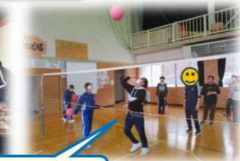
1月25日 ソフトバレー体験/フレンチトースト作り