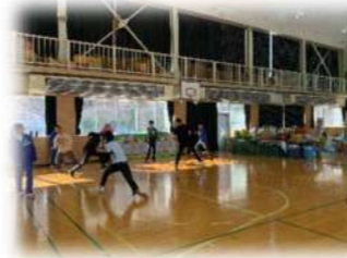
1月11日 ドッジボール体験/スターラボ