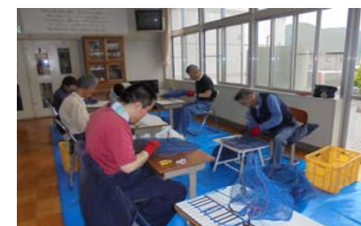
ホタテ網解体作業