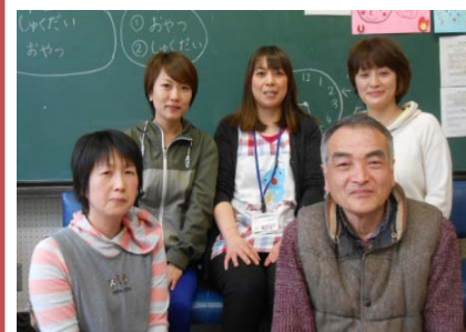
サポーターの皆さん

長期の休みにはマイクロバスでの遠足を計画しており、春休みにはアピオあおもりと県民福祉プラザに行ってきました。夏休みも遠足やおはなし会等いろいろな行事を計画しています。今年度もケガや事故がなく楽しく過ごせるようにみんなで協力していきます。