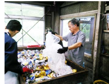
リサイクル班作業時の様子