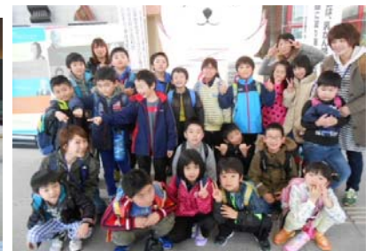
4月4日 春休み遠足 アピオあおもり