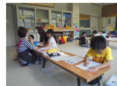
すこやか教室の様子