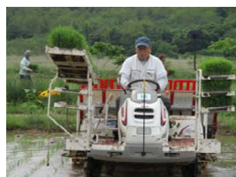
5月24日～6月2日田植え作業